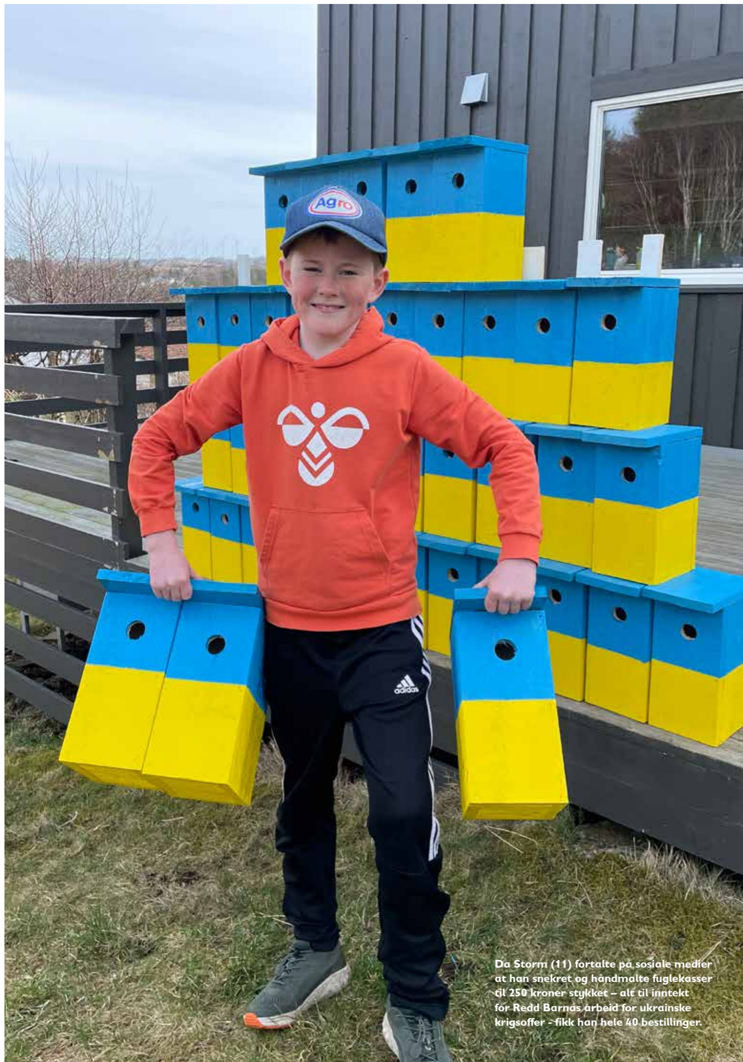
Da Storm (11) fortalte på sosiale medier at han snekret og håndmalte fuglekasser til 250 kroner stykket – alt til inntekt for Redd Barnas arbeid for ukrainske krigsoffer - fikk han hele 40 bestillinger.