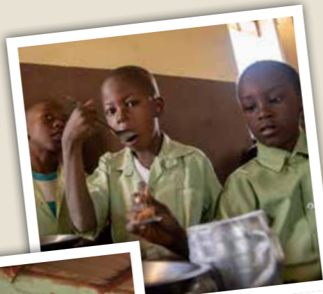
For mange barn er skolematen dagens viktigste måltid.