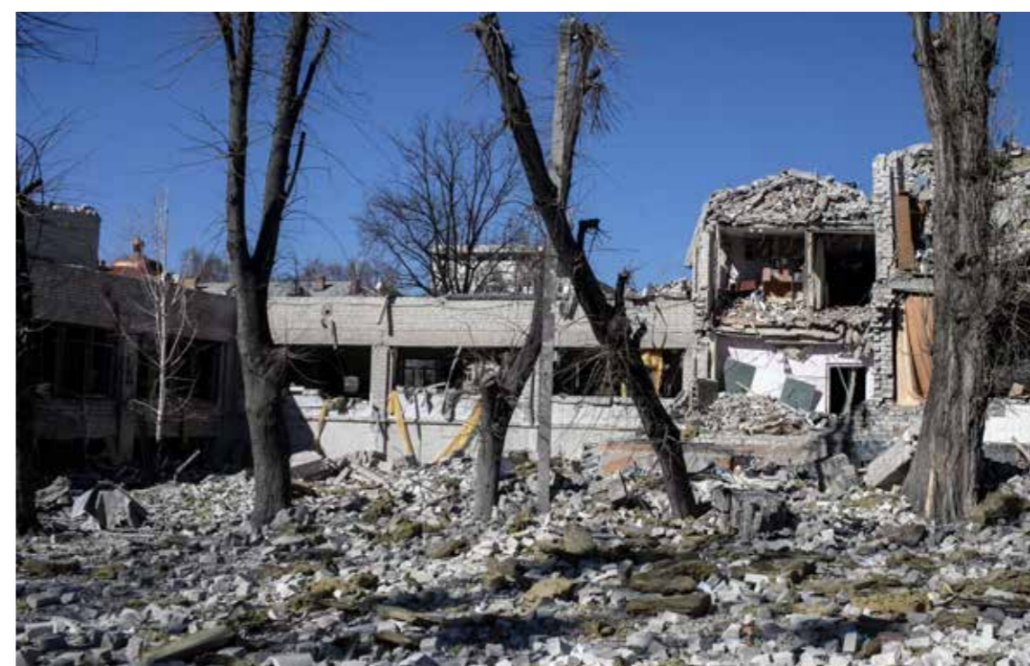
Dette er det som er igjen av en av skolene i Zhytomyr etter at den ble utsatt for angrep i mars. Hundrevis av skoler og helseinstitusjoner har blitt ødelagt under krigen.