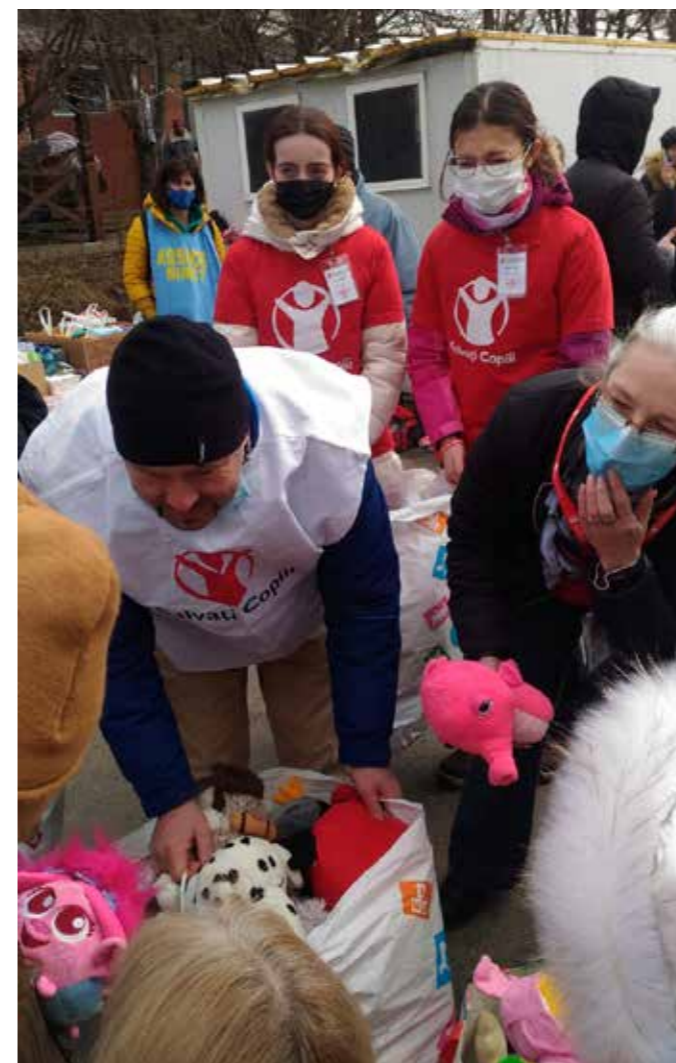
Redd Barna tar i mot flyktninger på grensen med nødhjelp og leker til barna.

Schjørlien forteller om hvordan Redd Barna og partnerorganisasjoner de første ukene hjalp folk til å komme seg ut av de mest urolige områdene. ▶