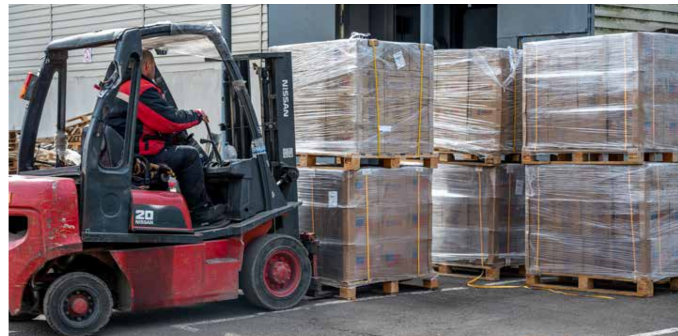
Redd Barna sender matvarer og andre nødvendige varer inn i Ukraina. Her lastes deler av en stor forsendelse som skal distribueres ut i sørøstlige deler av Ukraina fra Odesa.