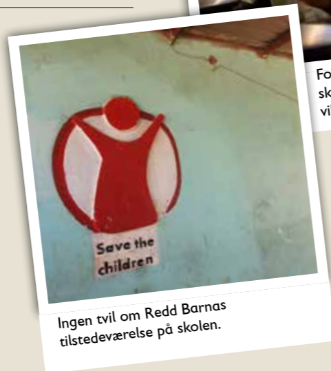
Ingen tvil om Redd Barnas tilstedeværelse på skolen.