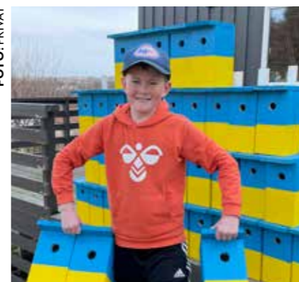
Unik giverglede fra barn side 16