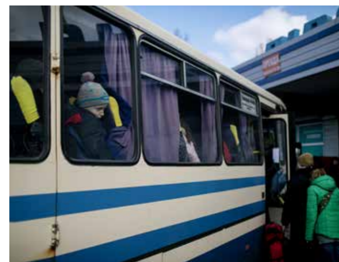
Redd Barna hjelper barn og familier til å flykte fra kamphandlinger inne i Ukraina, blant annet med transport med busser og biler.