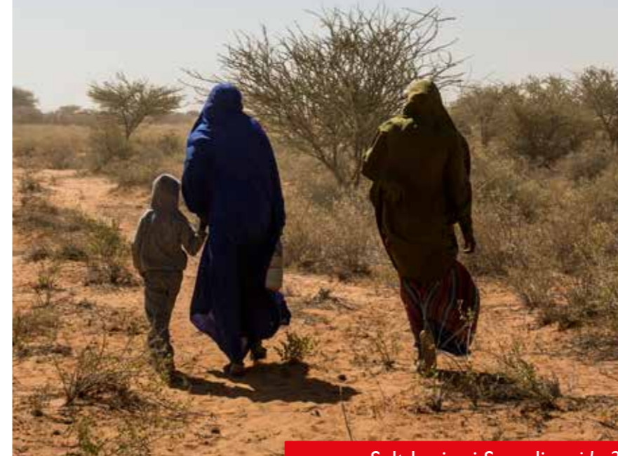
Sult herjer i Somalia side 20

Stadig flere familier må bryte opp fordi de ikke klarer å brødfø barna sine. Somalia og andre land på Afrikas horn står foran en sultkatastrofe.