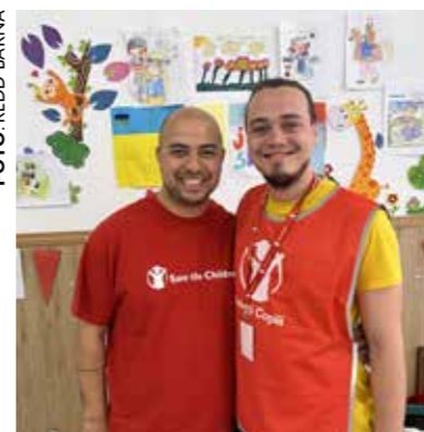
Stor innsats i Ukraina side 4