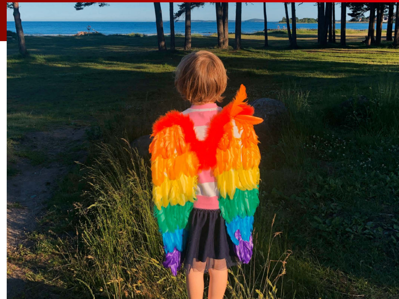
Regnbuevinger: Barn som bryter med normer for kjønn og seksualitet.