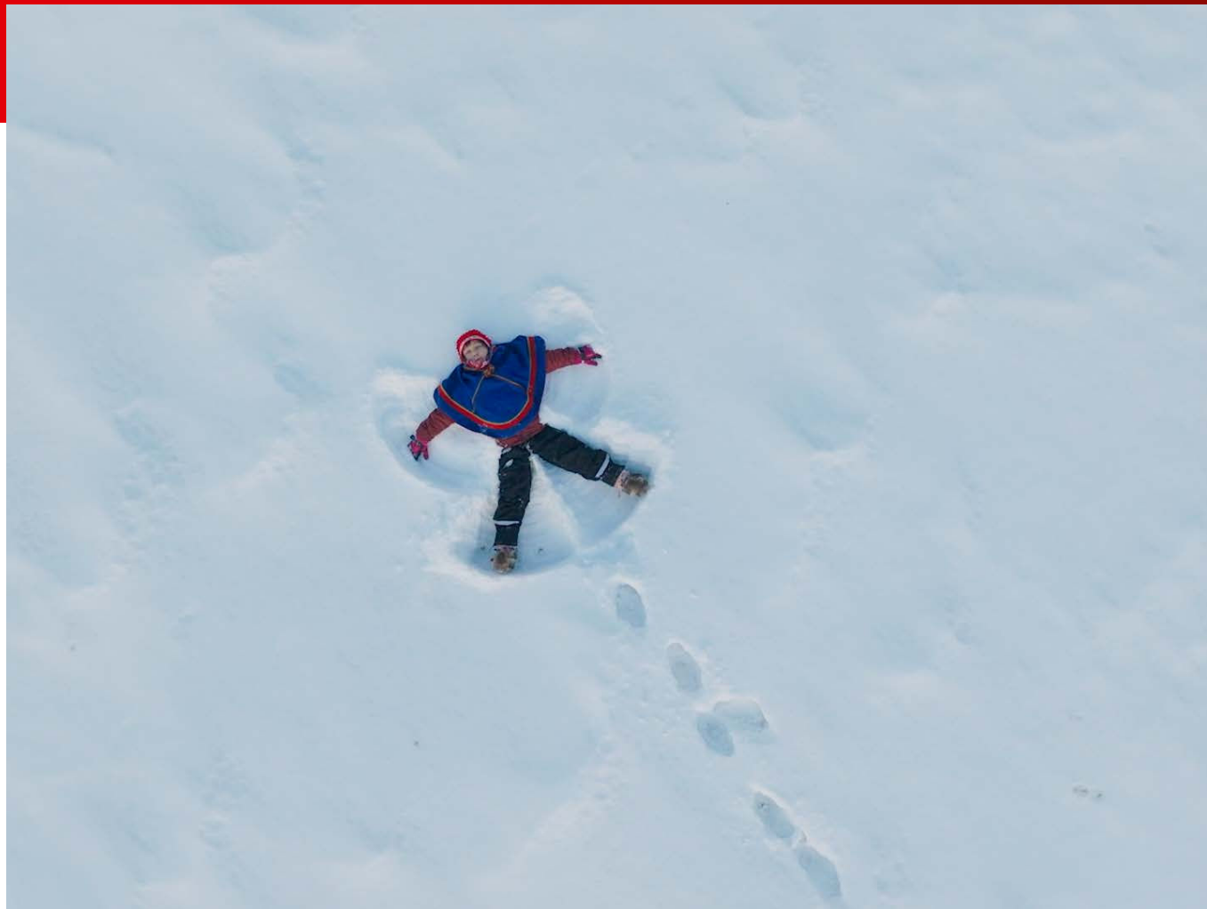
Snøengel: Samisk barn leker i snøen.