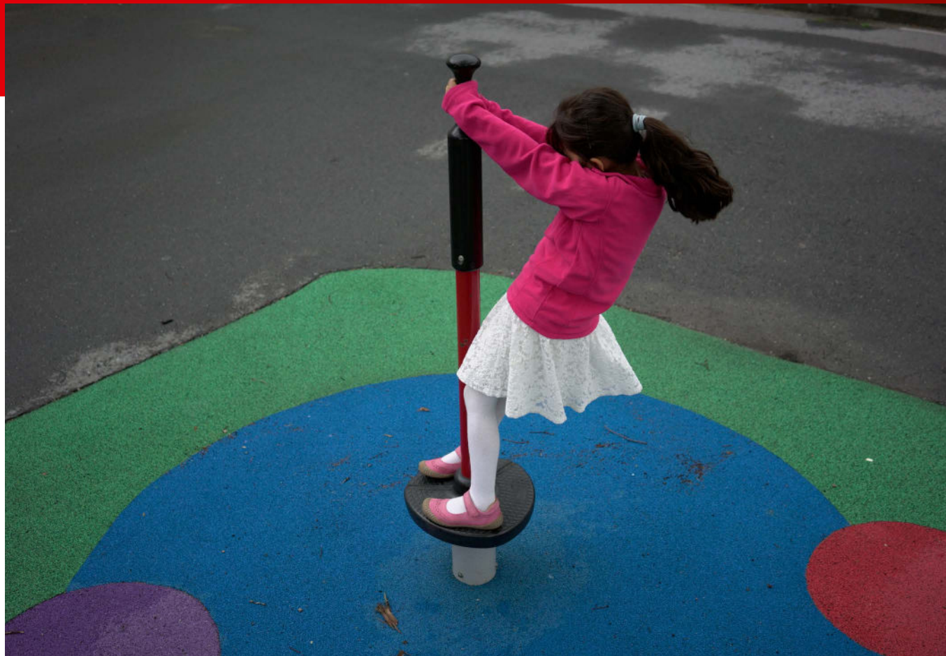
Barn som flykter: Oslo, Lysaker asylmottak (2016) Barn som leker på lekeplass.